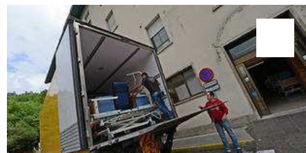
El hospital Álvarez Buylla, de mudanza