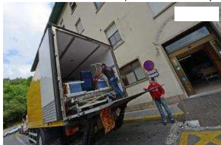
Dos operarios cargan material en un camión de mudanzas en Murias. J. R. Silveira